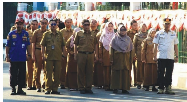
ILUSTRASI: ASN di Lebak.

"Penggunaan waktu kerja untuk kepentingan pribadi secara berlebihan bertentangan