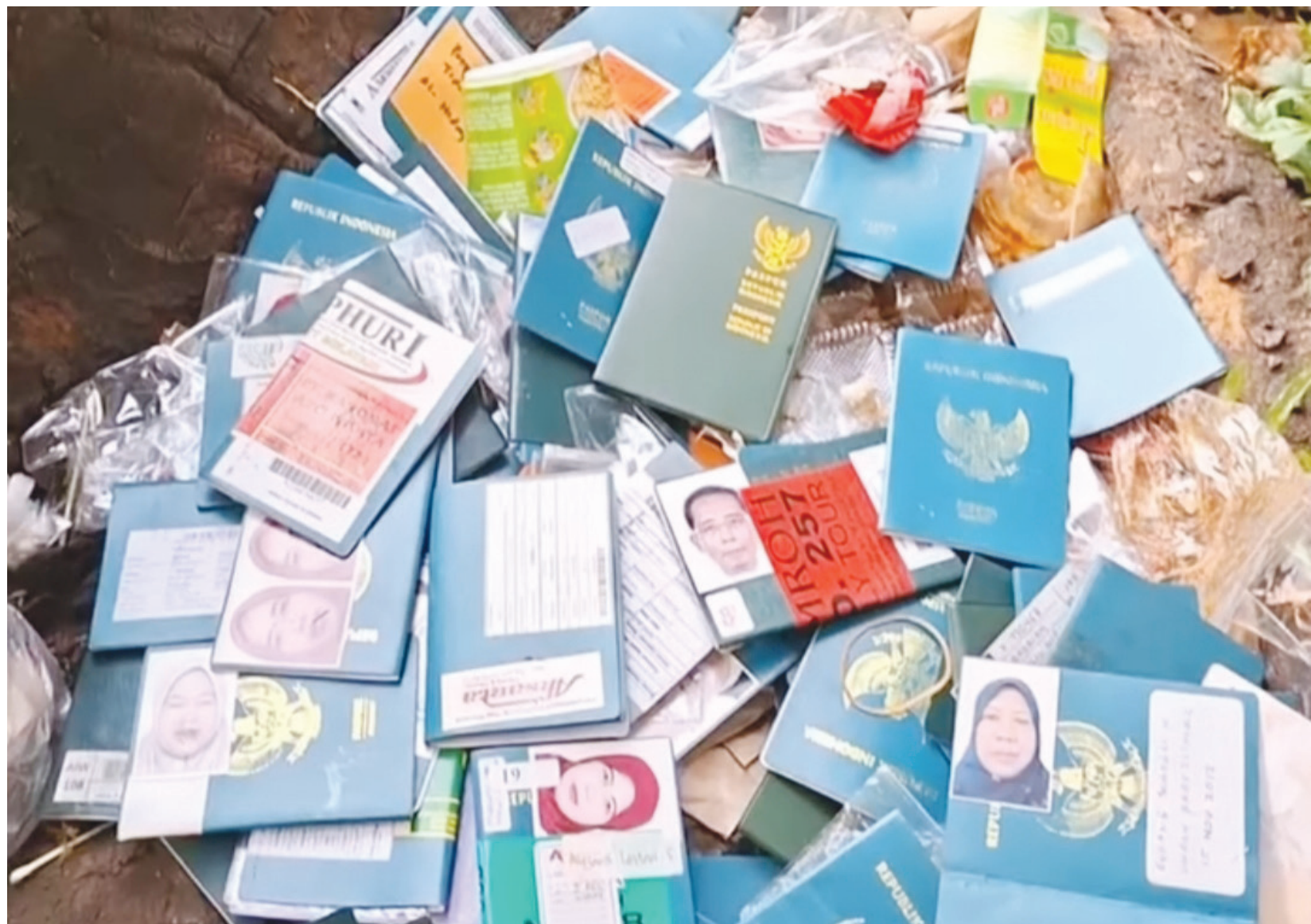
PASPOR BEKAS: Paspur bekas berserakan di pinggir Jalan Letjen Sutopo, Kecamatan Serpong, Kota Tangerang Selatan (Tangsel).