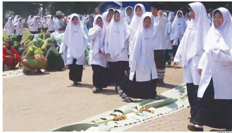
ILUSTRASI: Santri Lebak.

Dalam pembahasan itu, Pemkab Lebak menetapkan sasaran awal sebanyak 100 santri penerima manfaat. Program tersebut ditujukan bagi santri putra asal Kabupaten