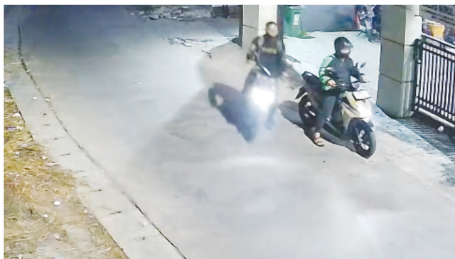
PELAKU CURANMOR: Dua pelaku curanmor terekam CCTV mengenakan jaket ojol saat beraksi.

Belum reda keterkejutan pemilik bengkel, aksi serupa kembali terjadi