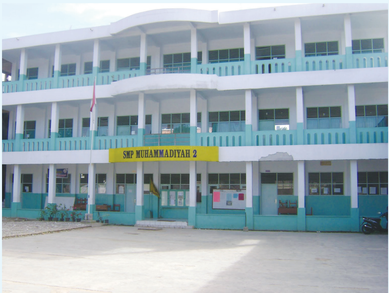
SEKOLAH GRATIS: Salah satu peserta sekolah gratis di Kota Tangerang adalah SMP 2 Muhammadiyah Ciledug.