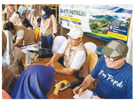
PENGOBATAN: Masyarakat saat mengikuti pengobatan.