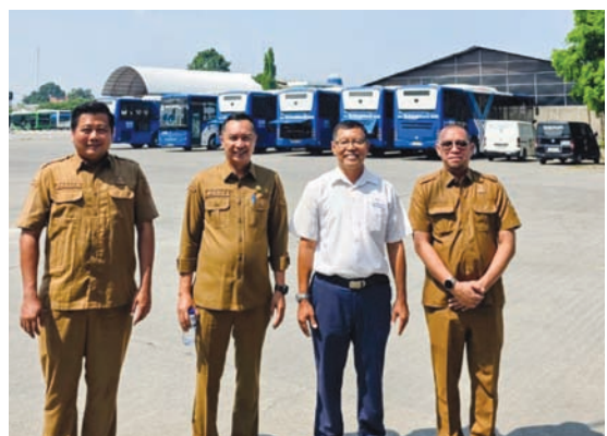
SAMBANGI KANTOR BUS: Petugas Samsat menyambangi kantor perusahaan angkutan umum.

"Target strategis kami, minimal 20 persen armada yang dimiliki perusahaan dapat terdaftar di Samsat Ciputat. Jika itu tercapai, tentu akan memberikan dampak positif terhadap peningkatan penerimaan pajak kendaraan bermotor di Provinsi Banten," tegasnya. (rmg/gatot)