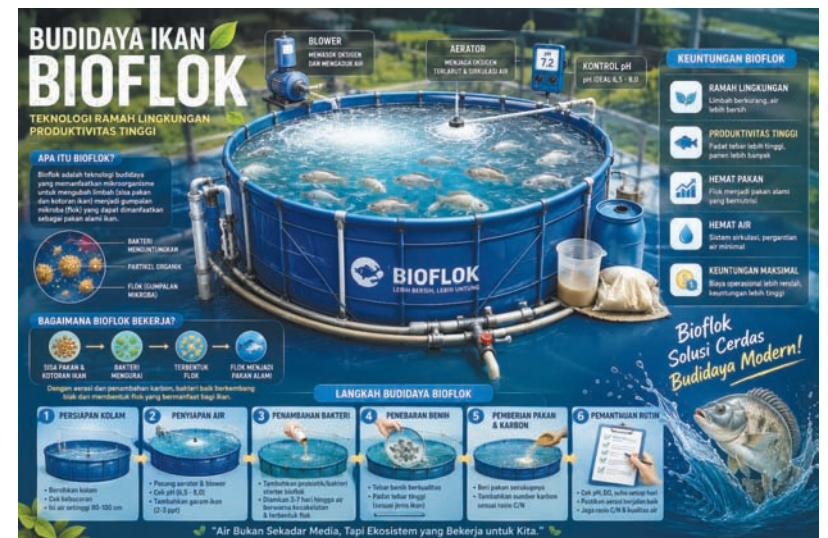
ILUSTRASI: Budidaya ikan sistem bioflok.

Ia menambahkan, pengembangan budidaya ikan sistem bioflok merupakan bagian dari program yang digagas Kementerian Kelautan dan Perikanan (KKP) untuk