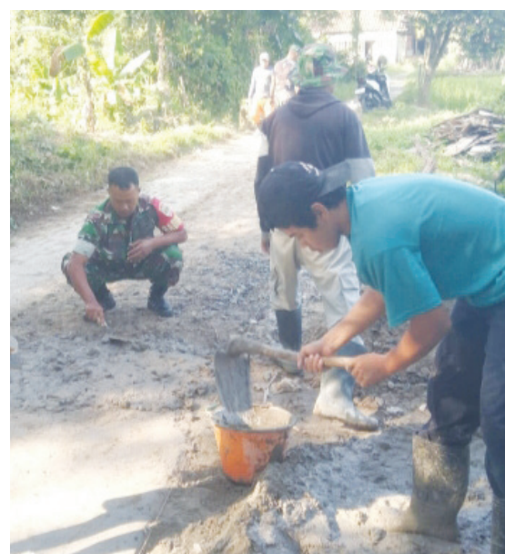
KOMPAK: Tampak warga dan Babinsa gotong royong memperbaiki jalanan berlubang di Kampung Bulakan, Desa Bitung Jaya, Kecamatan Cikupa, Senin (8/6/2026).

“Korban terlibat kecelakaan lalu lintas dengan kendaraan tidak dikenal yang melaju dari arah Bitung menuju Cikupa. Namun, kendaraan yang terlibat kecelakaan dengan korban melarikan diri dari tempat kejadian perkara (TKP),” pungkaskasat Lantast Polresta Tangerang, AKP Fery. ( alfian/alfian )