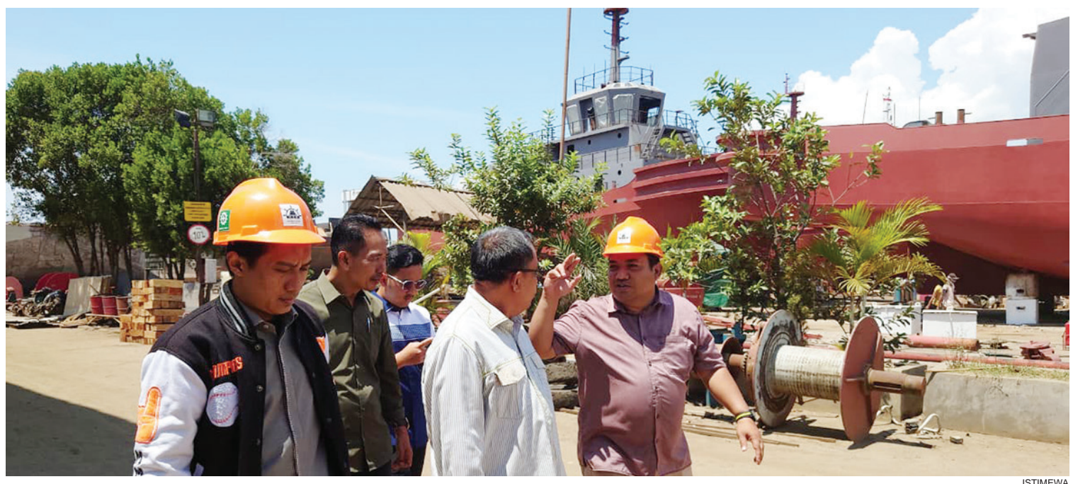
PENGAWASAN: Komisi IV Dewan Perwakilan Rakyat Daerah (DPRD) Kabupaten Serang, melakukan pengawasan terhadap perusahaan-perusahaan yang disinyalir mencemari lingkungan, kemarin.

Kemudian untuk aset eks Pasar Kragilan, Anton menjelaskan lahan tersebut juga masih berproses di pengadilan. (sidik/mardiana)