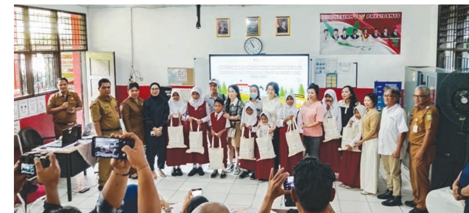
SERAHKAN BANTUN: Pihak PMI Kota Tangerang bersama Yayasan Amway Peduli menyerahkan bantuan alat tulis secara simbolis di SDN Panunggangan 9, Kecamatan Pinang.

Ia menjelaskan, sebelumnya kegiatan serupa dilaksanakan di Kecamatan Tangerang, sedangkan tahun ini dipusatkan di Kecamatan Pinang. PMI Kota Tangerang berkomitmen untuk ter-