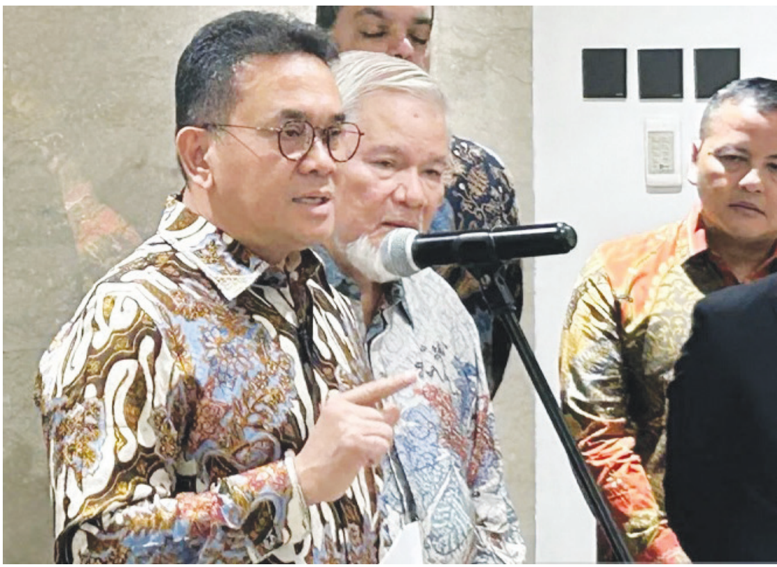
KONPRES: Menteri Perdagangan Budi Santoso dalam konferensi pers di Kantor Kementerian Perdagangan, Jakarta, Senin (8/6/2026).