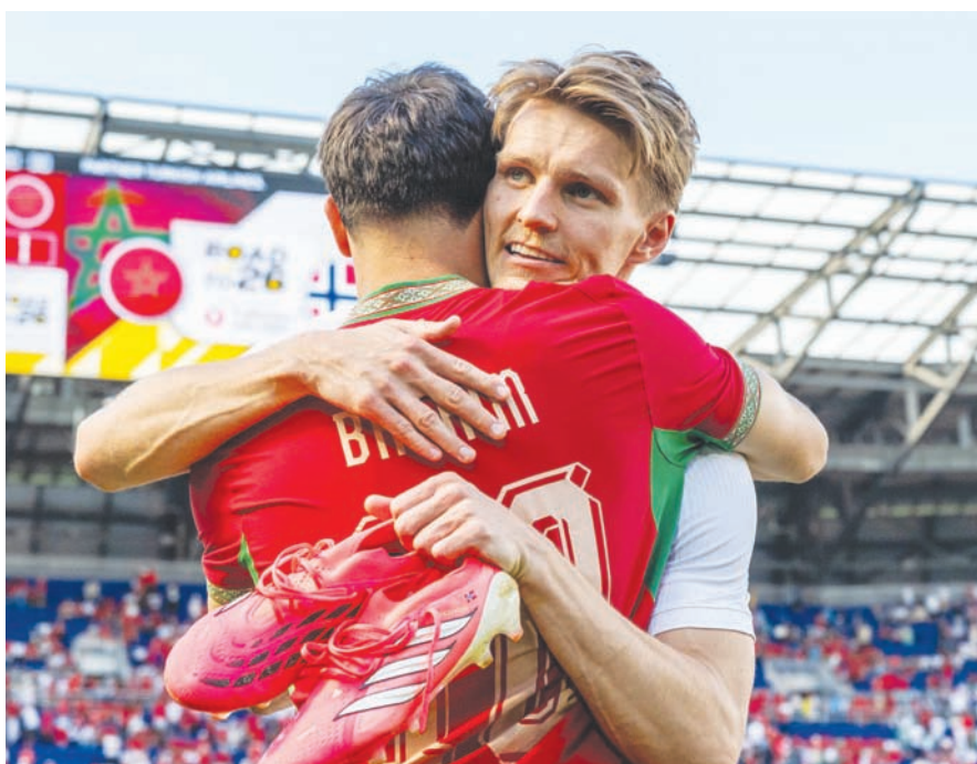
IMBANG: Maroko dan Norwegia bermain imbang 1-1 dalam laga uji coba jelang Piala Dunia 2026 di Stadion Sports Illustrated, New Jersey, Senin (8/6/2026) dini hari.

masi resmi mengenai tingkat keparahan cedera yang dialami Mazraoui. Namun, keputusan pergantian cepat mengindikasikan bahwa tim medis tidak ingin mengambil risiko menjelang Piala Dunia.