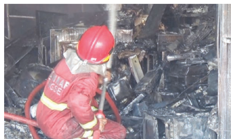
PEMADAM KEBAKARAN: Petugas Pemadam Kebakaran Kota Tangerang Selatan melakukan pemadaman api yang membakar toko elektronik.

Petugas masih melakukan proses pendinginan di lokasi guna memastikan tidak ada titik api yang tersisa. Sementara itu, operasional minimarket yang berada di samping lokasi kebakaran untuk sementara ditutup demi alasan keamanan. (eko/gatot)